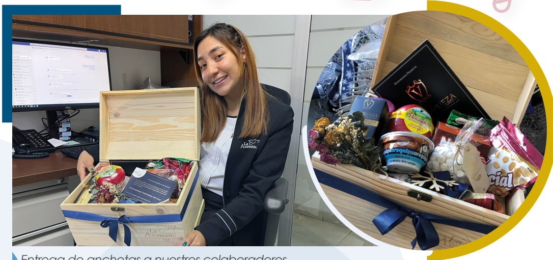
► Entrega de anquetas a nuestros colaboradores en La Ascensión.