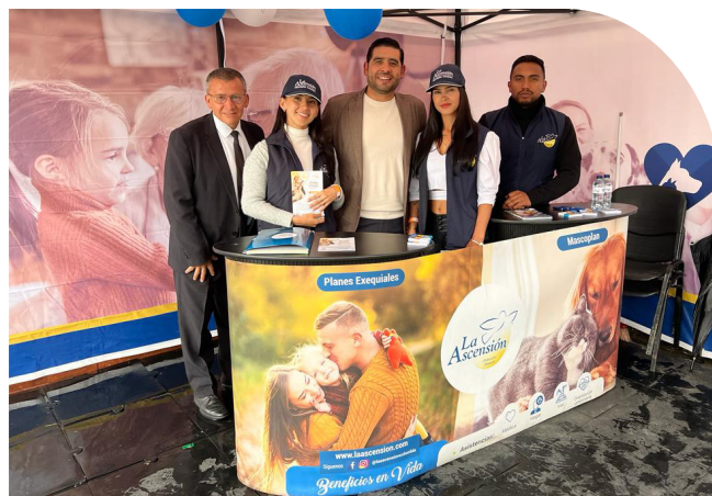
Foto. Evento campeonato nacional de salto. Gerente Nacional Fuerza Pública y Organismos del Estado, Coronel (RA) Jorge Hernando Morales Villamizar, junto al equipo de fidelización.

La compañía, estrechando sus lazos con las Fuerzas Militares, Policía Nacional y la comunidad en general, destacó en el XXII Campeonato Nacional de Salto Equestre, al dar a conocer, el innovador Mascoplan; el cual llamó en demasía la atención de los asistentes de este suceso deportivo.