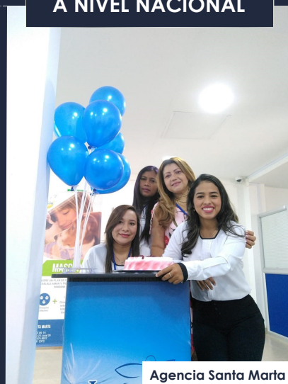
Agencia Santa Marta